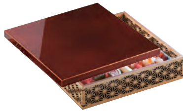
細密盛器用 春慶印籠蓋

19-121-01 (28004) 5,500円 約21×21×H1.8cm ※蓋のみ ※裏木曾春慶塗