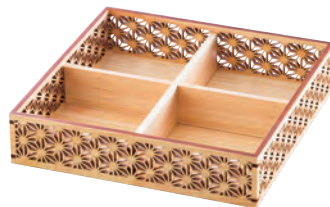
ひのき細密盛器 麻の葉 四ツ切