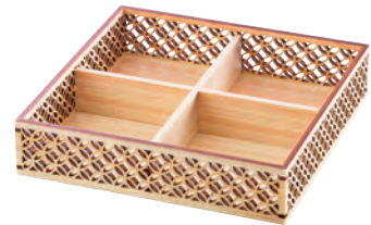
ひのき細密盛器 七宝 四ツ切