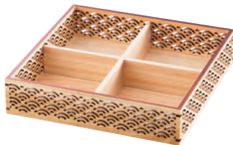
ひのき細密盛器 青海波 四ツ切

レーザー加工により繊細な文様を施したシリーズです。 最新の高度な技術と伝統柄の融合が新鮮な驚きを与えます。