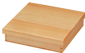
檜・ミニ松花堂弁当